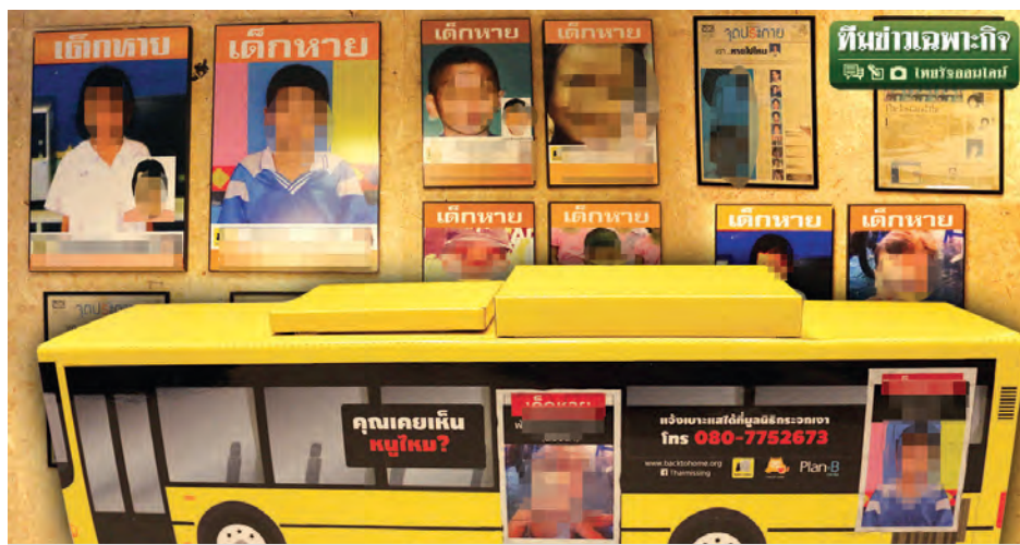
“รถเมล์... ตามหาเด็กหาย” เครื่องมือหนึ่งในการประชาสัมพันธ์หาเบาะแสของเด็กหาย

นอกจากกระบวนการรับแจ้งความคนหายแล้ว การประสานงานฝ่ายสืบสวนเพื่อลงพื้นที่สืบสวนติดตามคนหายอย่างทันที่ทันที่ นับว่าเป็นกระบวนการสำคัญ ที่พนักงานสอบสวนควรดำเนินการประสานงานหลังการรับแจ้งความทันที แต่มักพบปัญหาว่าเมื่อครอบครัวคนหายแจ้งความคนหาย มักได้รับเพียงสำเนาการแจ้งความเพียงแผ่นเดียว โดยไม่มีการประสานหน่วยงานที่เกี่ยวข้องทั้งการสืบสวนและประชาสัมพันธ์ นี่เป็นเหตุผลสำคัญที่ครอบครัวคนหายรู้สึกว่าไม่ได้รับการช่วยเหลือเท่าที่ควร จึงร้องทุกข์ไปยังสื่อมวลชน หรือเอ็นจีโอ เช่น มูลนิธิกระจกเงา หรือมูลนิธิปวีณาเพื่อเด็กและสตรี เป็นต้น เอ็นจีโอและสื่อมวลชนในประเทศไทย จึงมีบทบาทเป็นตัวกลางในการประสานความช่วยเหลือ ซึ่งเป็นช่องว่างของหน่วยงานราชการที่ขาดประสิทธิภาพ โดยทำหน้าที่วิเคราะห์ข้อมูล ประสานงาน สืบเสาะข้อเท็จจริง ทำการประชาสัมพันธ์ข้อมูล เพื่อให้เกิดกระบวนการติดตามหาคนหายที่มีประสิทธิภาพขึ้น